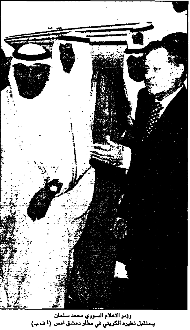
وزير الاعلام الكويتي يوسف السميح في مطار دمشق امس

الكويت - اف ب: تزعت وكالة الانباء الكويتية امس الثلاثاء ان وزير الاعلام الكويتي يوسف السميح يزور سورية. الكويت - اف ب: تزعت وكالة الانباء الكويتية امس الثلاثاء ان وزير الاعلام الكويتي يوسف السميح يزور سورية. الكويت - اف ب: تزعت وكالة الانباء الكويتية امس الثلاثاء ان وزير الاعلام الكويتي يوسف السميح يزور سورية.